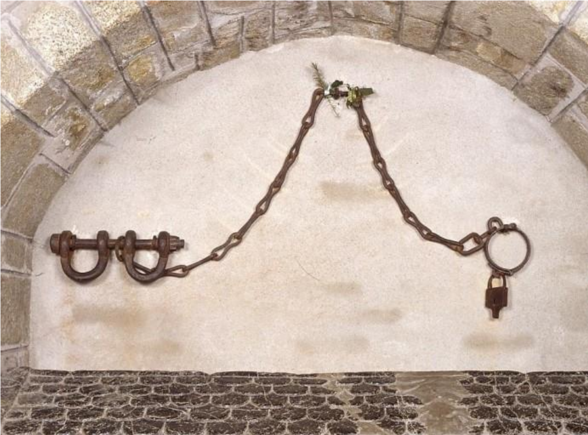
Ex Voto dit « le Verrou » Collégiale de Saint Léonard Haute Vienne