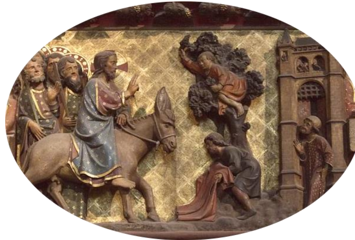
Entrée du Christ à Jérusalem Cloture du Choeur Notre Dame de Paris