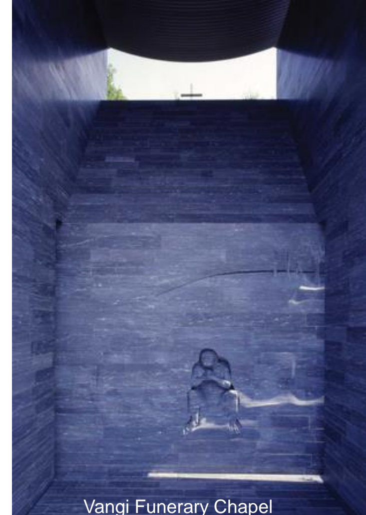
Vangi Funerary Chapel Azzano di Seravezza By courtesy of Arch Botta