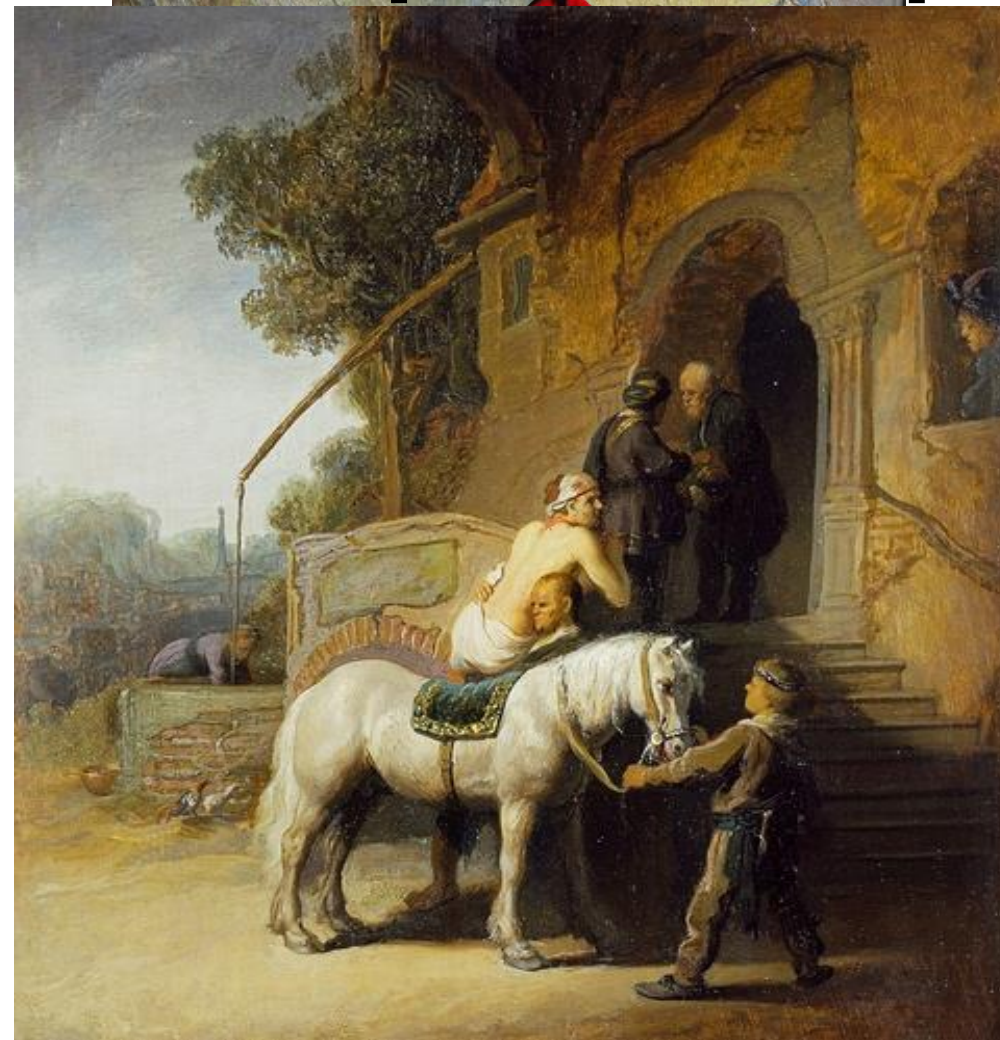
Vitrail Cathédrale de Chartres Van Gogh, 1890 Rembrandt, 1631, Musée de la Ville de Paris, Paris Rijksmuseum Kroller-Muller, Otterlo Londres