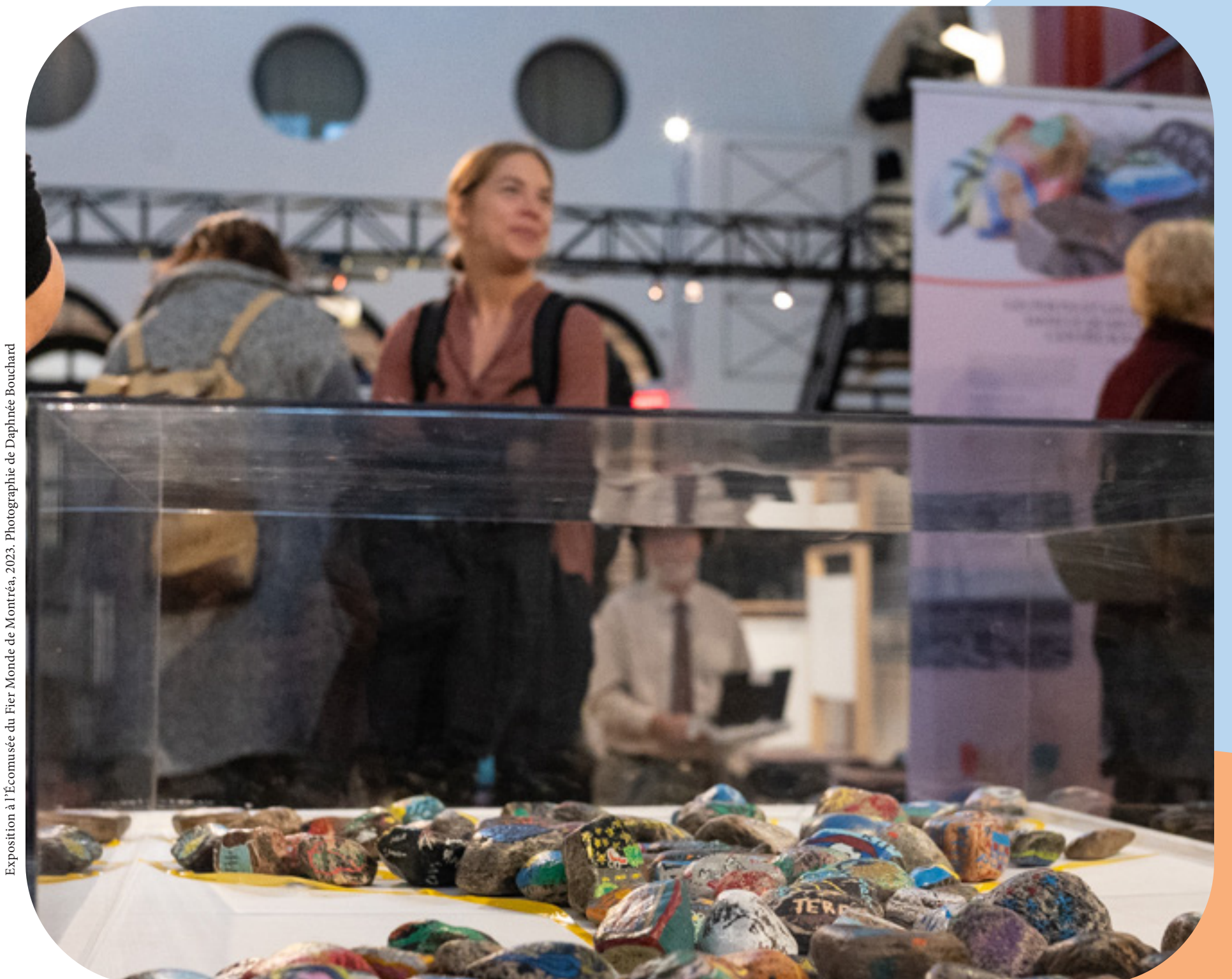
Photo de Marie-Josée Dupuis, 2022. Photographie de Marie-Josée Dupuis.