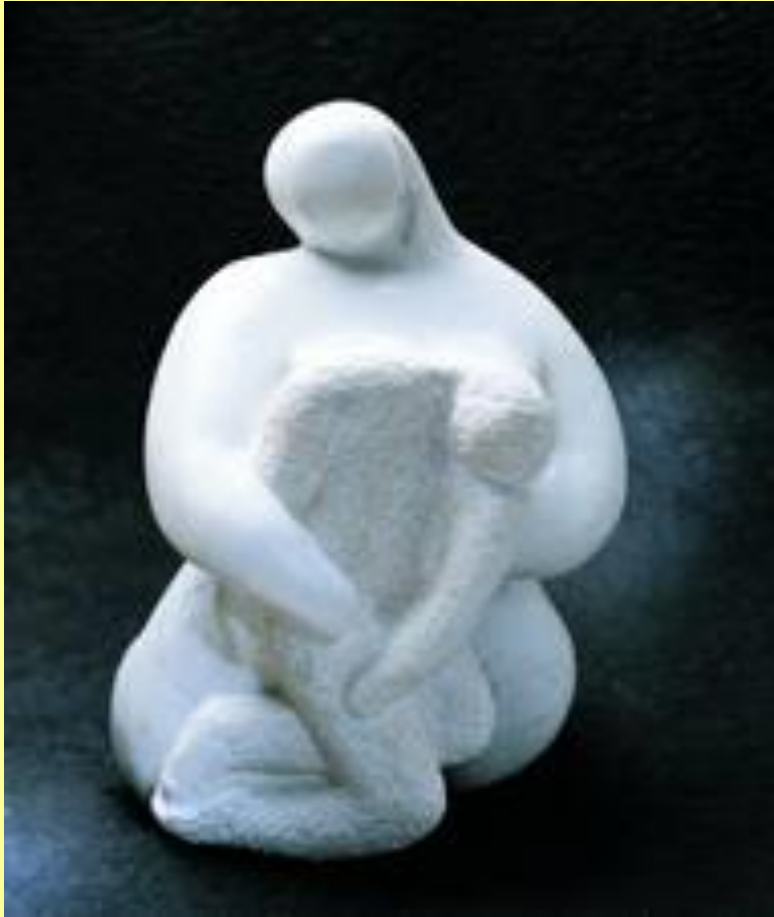
« Trilogie de la séparation » Voledda, 1997