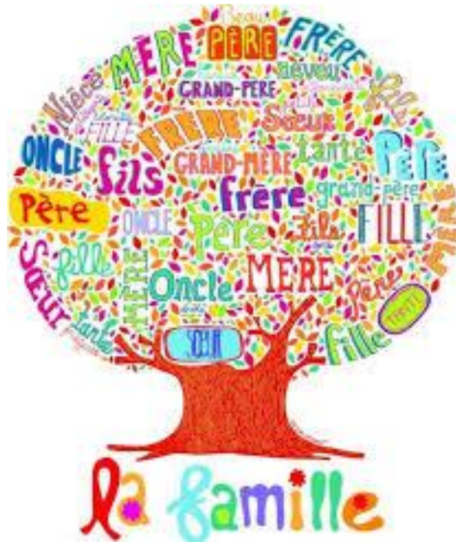
Arbre famille foyer-rural-saint-leonard.fr